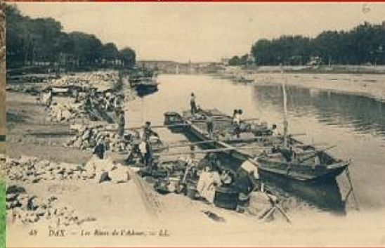
45 DAX - Les Bords de l'Adour - 1888